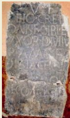
La lapide romana di Esio

"Far meglio conoscere il lago Maggiore ai figli suoi, innamorarli delle sue bellezze naturali ed artistiche, evocare alle anime loro le memorie dei padri; illustrare a loro esempio le nobili figure degli uomini superiori che passarono tra noi, studiando, lavorando, beneficiando..." (A. BRICCHI, 1905)